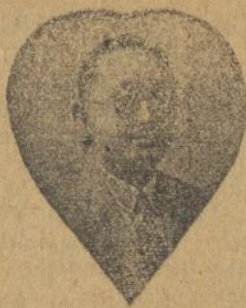
Sinshe : LAW CHEE MING L.T.T.

Pada 3 taon jang laloe saja mendapet penjakit badan mati sebelah, kaki losoet pada bengkak dan tida bisa bergesek, bingga soeda berobat pada Dokter en Sinshe di ini kota tapi tida terteloeng, maka oentoeng dengan perantara'annya saja poenja sobat, saja soeda dapat perteloengannya sinshe terseboet.